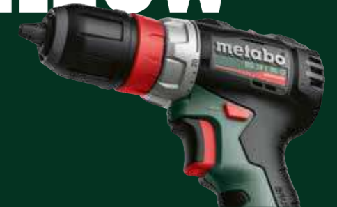
18 Volt boorschroef- en klopboormachines, blz. 8