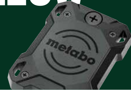
Tracker, blz. 11