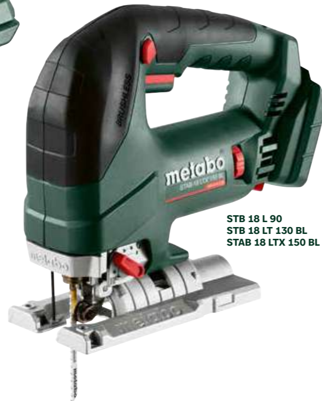
STB 18 L 90 STB 18 LT 130 BL STAB 18 LTX 150 BL

18V CAS BRUSHLESS GRATIS ACCU ZIE ACHTERPAGINA