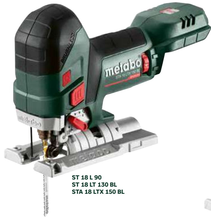
ST 18 L 90 ST 18 LT 130 BL STA 18 LTX 150 BL