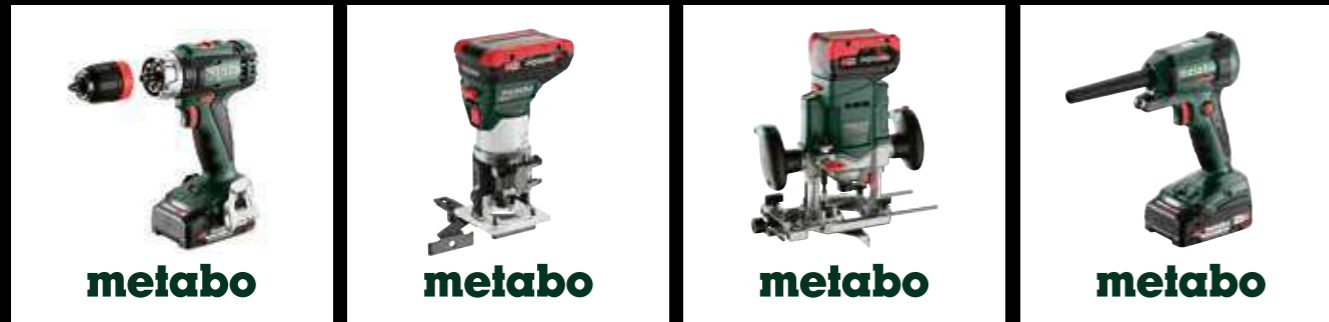
Klop-/ boorschroefmachines SB / BS 18 L Q

Zagen, boren, schroeven, tackeren, spijkeren – CAS maakt het mogelijk met meer dan 40 compatibele merken. En met ons innovatieve CAS-accu-systeem was het wisselen tussen de verschillende machines nog nooit zo eenvoudig.