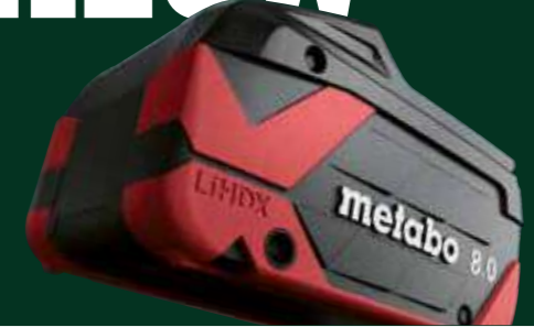
LiHDX accu's, blz. 4